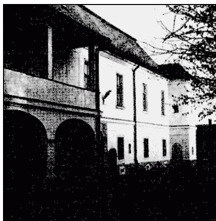
Szegvár, a volt vármegyeháza

A második világháború után még mintegy tíz évig az örök megújulásban és önmaga erejében hívő parasztság saját maga építette a többnyire hagyományos elrendezésű lakóházait a régi építő és építkező szokásoknak megfelelően, de már ekkor is megjelentek a hagyományostól elrugaskodó, divatos vagy egyszerűen csak a gyakorlati előnyökre tekintő, vagy adottságokhoz alkalmazkodó épületek.