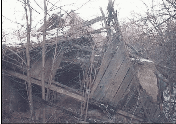
Lakóház leszakadt hátsó része