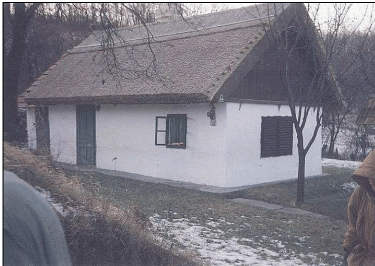
Felújított szabadidős ház

Elindulunk felfelé a dombra, ahol vidámabb kép fogad. Felfedezzük az előző ház ellenpontját, egy szépen felújított szabadidős házat. Még az ablakokat keretező barna keret is szépen faragott, a ház előtt gondozott pázsit van fiatal gyümölcsfákkal, kerek kúttal. Diszkrétén szerelt tápkábel vezet le a búvárszivattyúhoz. Kissé távolabb ettől a háztól érdekes jelenséggel találkozunk. Valaki egy nádfedeles – de íves homlokfala folytán láthatóan újkori – pincebejárati építménnyel próbált a hagyományokhoz igazodni. Az építmény jó benyomást kelt, bár mészkő fala kissé szokatlan, ezen a tájon nem ez a természetadta építőkö – arra az csak emelkedőt magunk mögött hagyva találunk rá, amikor az elhagyatott Kőhányás nevű részhez érünk: partfalain szélfúttá homokkő-képződmények figyelhetők meg.