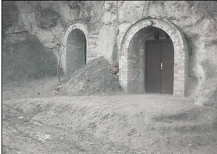
Ketten a négy pincéből

A löszmélyútból egy domboldalra érünk, ahonnan egy kisebb völgytöbör képe tárul elénk. A völgy alsó bejárata a talajerózió miatt járművel régóta járhatatlan, ezért helyiek a telkek egy részét elhagyták, a völgy napsütötte oldalán azonban páran ma is szőlőt művelnek. A hely az emberkézre utaló rend és a természet rendezetlenségének sajátos harmóniáját árasztja. Itt az ember használja és nem kihasználja a természetet . – A völgy felső részén egy nádtetős házat találunk, falait a közelmúltban szakaszosan téglá anyagúvá építették át, aajtáját is kicserélték. Egy évtizede még megvolt a régi, közepén keresztben „elvágot” aajtó. Ez főként Közép-Dunántúlon és szórványosan Észak-Dunántúlon előforduló sajátosság. Ha a földém kialakulása megelőzte a nyitott kémény kifejlődését, gyakori volt az ún. füstös konyha, melynél a füst az aajtón át távozott. A „félbevágott” aajtó felső részét kinyithatták a füstnek, míg az alsó zárva maradt. Védte a kisgyerekeket, kirekesztette az udvar háziállatait is. Az épület nádazása és oromdeszkázata is új, és sajnos a korábbinál sematikusabb is. Korábban még keresztirányú, faragványokkal díszített deszka is volt az oromzatcsúcs közelében. A padlást lezáró oromdeszkázatba a legtöbb házon kedves szellőzőnyílás-mintákat faragtak. Az oromdeszkázat és a homlokzati fal találkozásánál sormintával díszített vízvető léceket vezettek végig. Ez a népi díszítőkultúra mára szinte teljesen eltűnt.