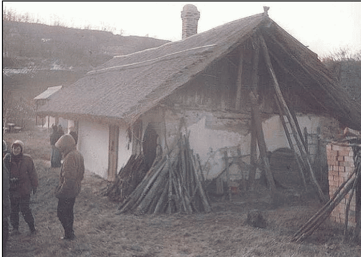
Ágasfás tetőszerkezetű ház