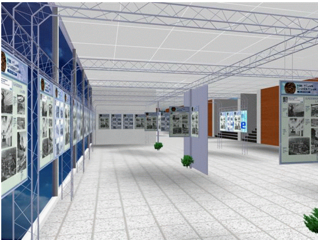
A kiállítás látványterve