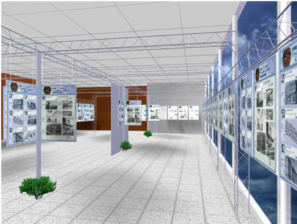
A kiállítás látványterve