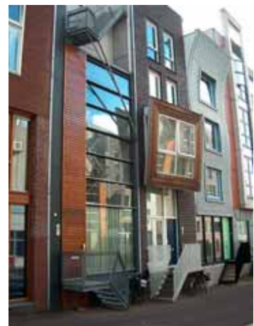
Utcakép / hangulat a Java-Eilandon