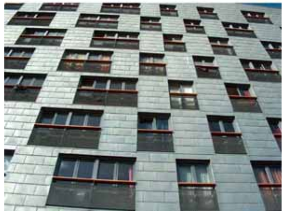
The Whale, tervezők: de Architecten Cie./Frits van Dongen

.....folytatni fogom a szigetek bemutatását, megér még pár jelentést, ez csak a töredéke ennek a kincsesládának!