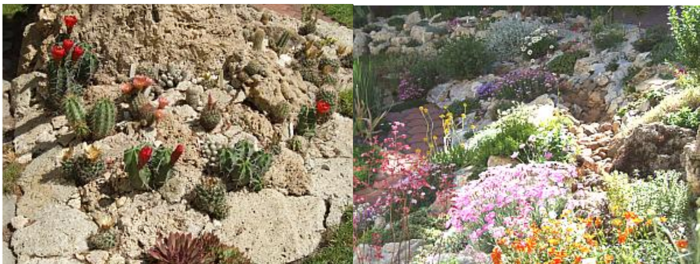
Télálló kaktuszok forrás mésztufában.