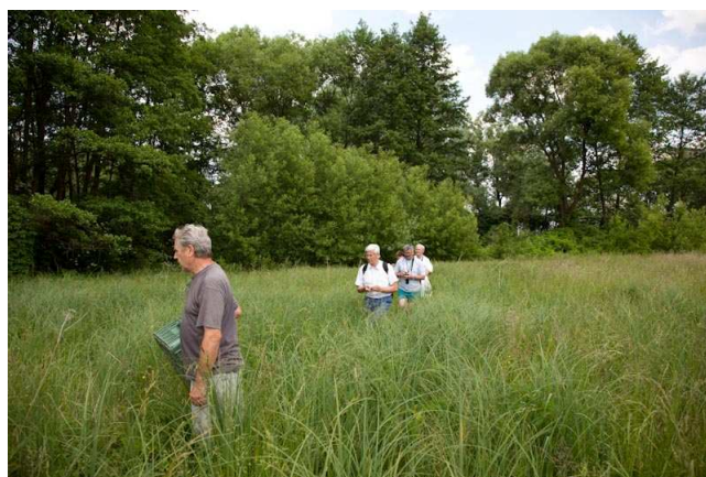
Keressük az orchideákat, meg is találjuk!