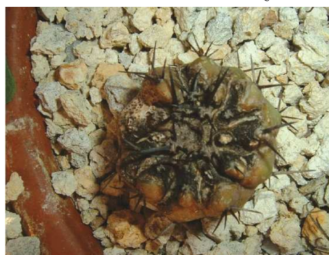
Korompenész, mint járulékos fertőzés.

A képek megjelentek a Debreceni Pozsgástár 2007. 2. számában, Kovács Mónika: Kaktuszok és más pozsgásnövények leggyakrabban előforduló gombás betegségei és az ellenük való védekezés című cikkében.