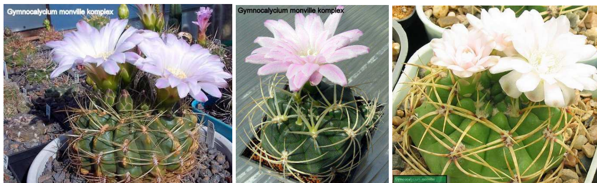
A képek mindegyike Gymnocalycium monvillei .

A komplex fajai, alfajai, ill. azok változatainak populációi elsősorban Argentínában, Córdoba és San Luis tartományban, ezeken belül pedig a Sierra Grandes, a Sierra Chicas de Córdoba illetve a Sierra de San Luis hegyláncok oldalain, a sziklák védelmében, és lent a völgyekben élnek. H. Till-től tudjuk (1993): „A G. achirasense , G. brachyanthum , G. horridispinum , G. monvillei és G. schuetzianum fajok morfológiailag nagy hasonlóságot mutatnak. Másrésztől, ezek elterjedése egyértelműen elkülönülnek egymástól. Javasoljuk tehát itt, hogy értékeljük a fenti taxonokat (kivéve G. schuetzianum ) a G. monvillei alfajainak...”