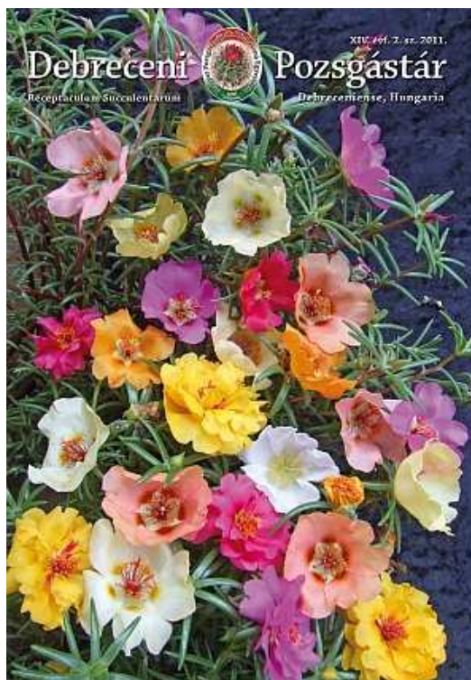
A 2. szám címlapja