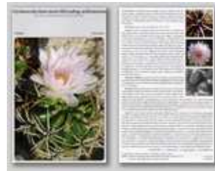
Gymnocalycium monvillei var. wrightii