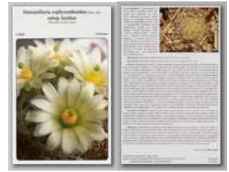
Mammillaria zephyranthoides subsp. heidia