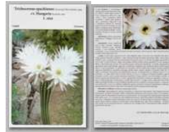
Trichocereus spachianus cv. Hungaria