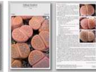
Lithops hookeri ssp. cardenianum