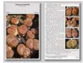
Lithops bromfieldii subsp. hirtum