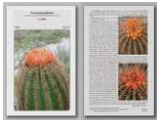
Ferocactus pilosus1. rész