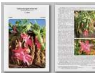
Schlumbergera truncata 1.