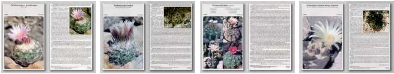
Turbincarpus x mombergeri Turbincarpus hoferi Gymnocalycium eurypleurum Ariocarpus retusus subsp. trigonus Gymnocalycium riojense subsp. kozelskyianum Gymnocalycium kieslingii Gymnocalycium carminanthum (a 3. előlapon négy Gymnocalycium leírása található!)