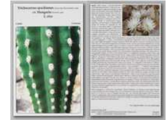
Trichocereus spachianus cv. Hungaria