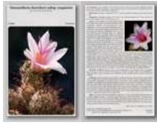
Mammillaria thornberi subsp. yaquensis