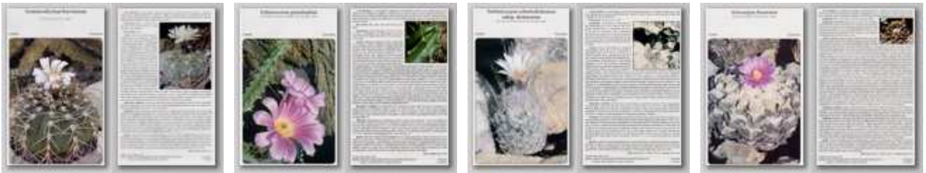
Gymnocalycium bayrianum Echinocereus pentalophus Turbincarpus schmiedickeanus Ariocarpus fissuratus ssp. dickisoniae