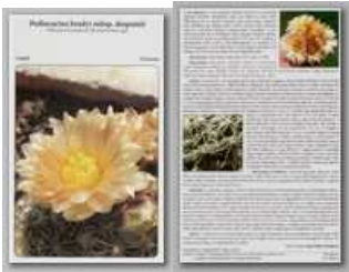
Pediocactus bradyi subsp. despainii