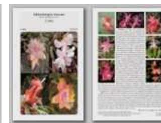
Schlumbergera truncata 2.