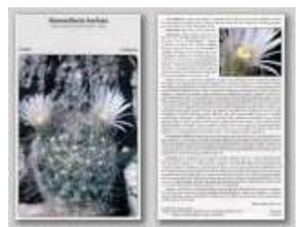
Mammillaria barbata subsp. flaviflorus