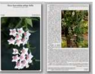
Hoya lanceolata subsp. bella