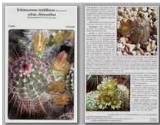
Echinocereus viridiflorus subsp. chloranthus