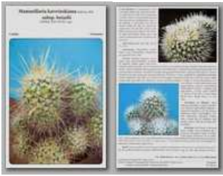
Mammillaria karwinskiana subsp. beisei