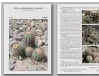
Mila caespitosa v. hysticina