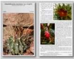
Glandulicactus uncinatus subsp. achirasense