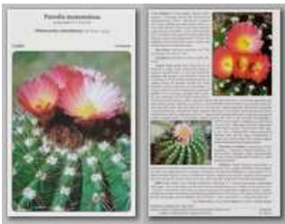
Parodia mammulosa (Notocactus roseoluteus)