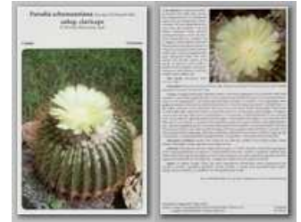
Parodia schumanniana subsp. claviceps