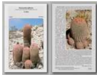
Ferocactus pilosus2. rész