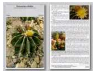
Ferocactus echidne ssp. grandiflorus