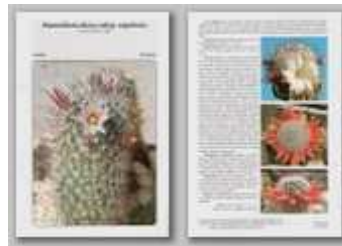
Mammillaria dioica angelensis