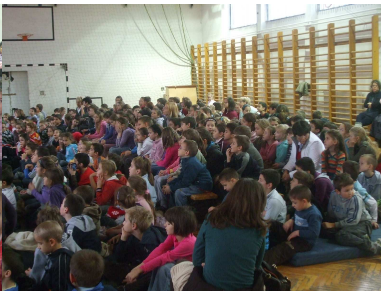
De a többség feszülten figyel.