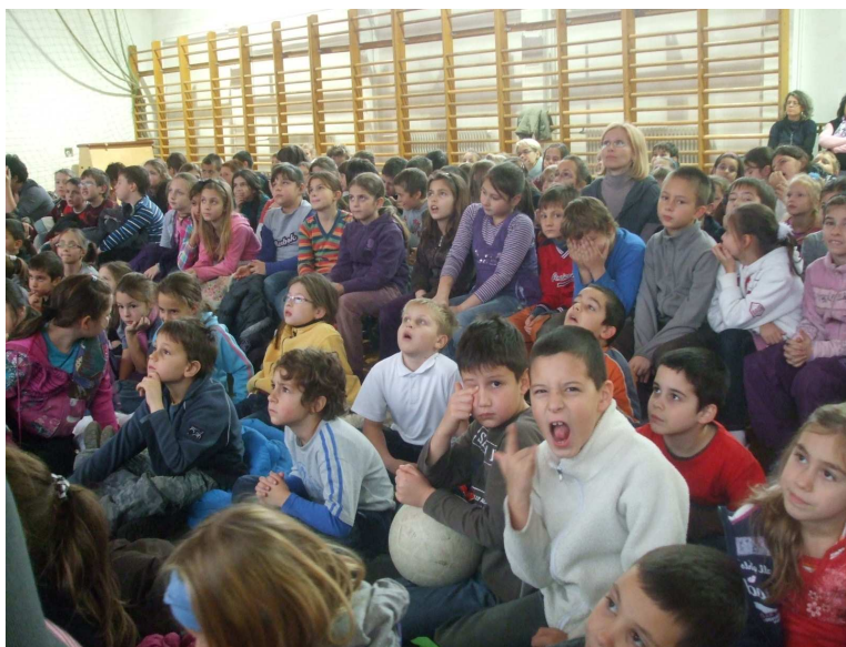
Van, aki már „nagyfiú”.