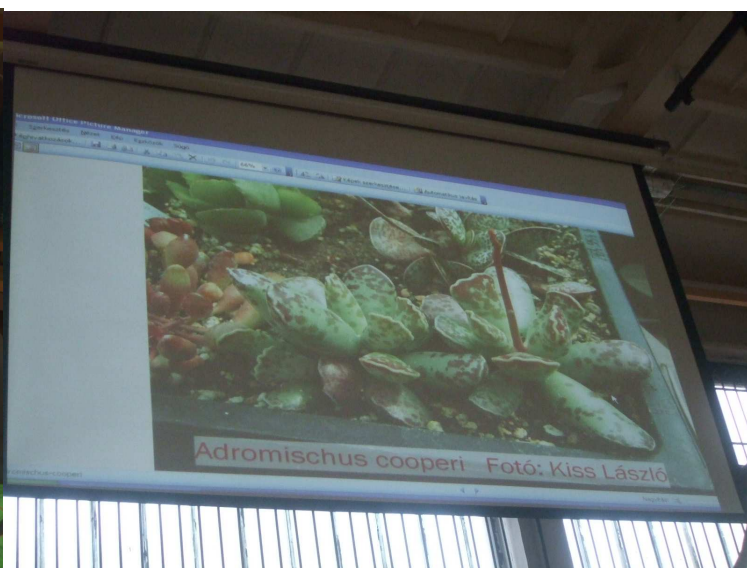
Egy a sok közül, ami kiváltja a csodálatot!