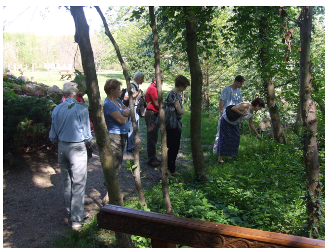
Valamit keresünk a kis patak partján?