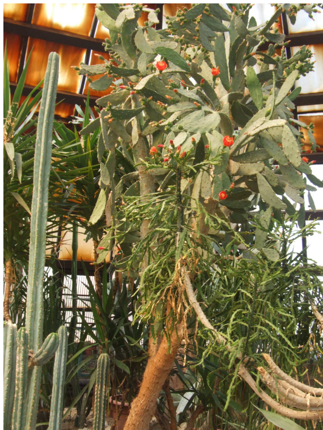
Virágzik a hatalmas Opuntia ficus-indica .