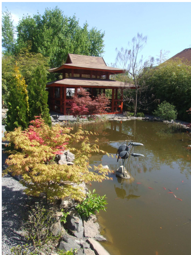
A japánkert tavaszi színeiben.

Társaságunk május 28-án látogatást szervezett a nyíregyházi Botanikus Kertbe. Arról most is meggyőződhattünk, hogy megunhatatlan, hiszen mindannyiszor más és más arcát mutatja a természet. Igazán szerencsések voltunk a kiváló időjárással és a látogatás időpontjával, mivel a növények látványos virágzásában gyönyörködhettünk. hogy mit láttunk? Néhány képen bemutatjuk, ami a látottaknak csak töredéke.