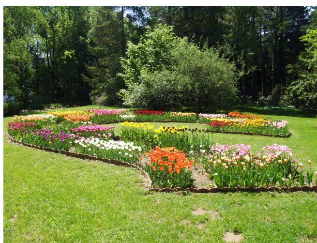
Részletek a tulipán gyűjteményből.