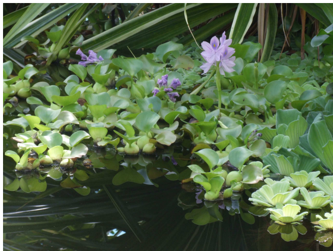
A vízi jácintok is virágoztak.