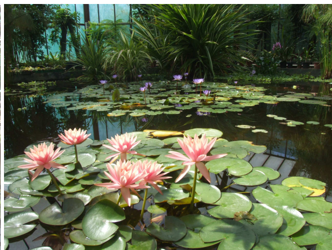
Fehér tavirózsa rózsaszín változata