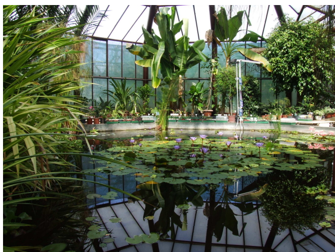
A trópusi üvegház.