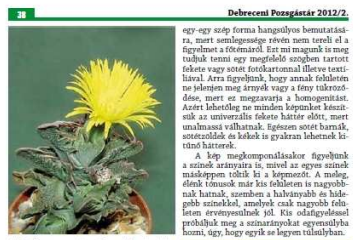
4. Kép: Nem szerencsés a rokon szék példájánál, bizony a székgyógyász. Fouquieria típusa.

Sok mindent elmondtál, de azért szeretném megkérdezni, vannak e kedvenc növényeid? Igazából nincsenek kedvenceim. Sokféle növényem van, mint ahogy említettem, minden evő vagyok. A Melocactusok , amelyből készletem 120-130 db, jelenleg több törődést kapnak, remélve, hogy minél előbb sapkásodnak. Már van vagy 30 db, ahol ennek jele már jól látható. A növényeket be kell szüntetni, melyen tapasztalatok vannak az üvegházban? A nyitogatás gyökér tapasztalatát a gyökérbe véve, de jó magam a kaktusztan, tőre egyszemű kaktusok három-négy ládával, előszörben Echinopsis virgata . De vannak olyan növények, amelyek két többször a székben, így a már említett Echinopsis virgata is megvan, és egy-két Oreocereus fűrészt. A nem fűrésztől behoztam egy székfűrészt, ahol Döglök Sálga albányokom három a ládákban bókli. Nyilván ennek arany oka van, mivel az üvegház fűrészt nagyon kellemes. Számítás szerint lehet, hogy lassú 100.000 Ft-ból ki sem telne az üvegház fűrészt, s ezt már