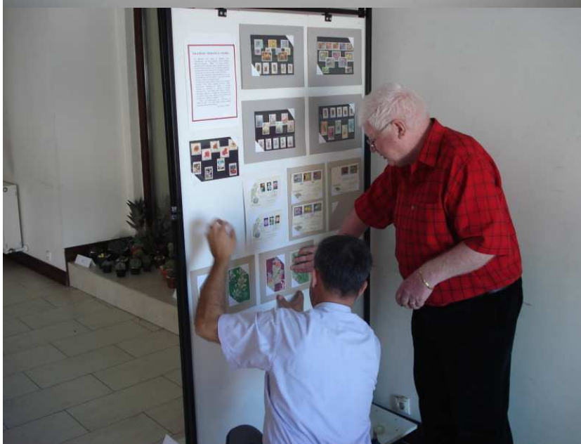
Készül a tematikus bélyegek kiállítása.