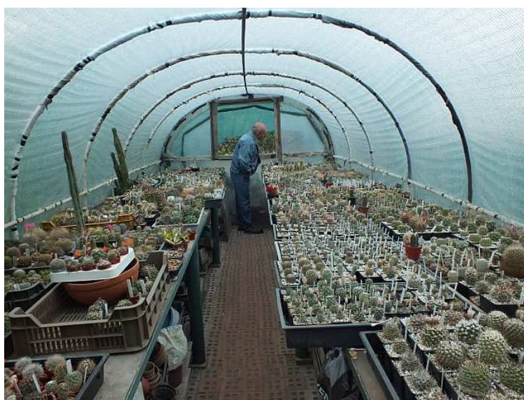
A zsúfolásig betelt egyik fóliaház.