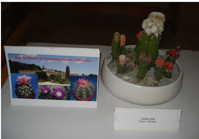
A kassai Kaktusz Klub érdekes kompozíciója.