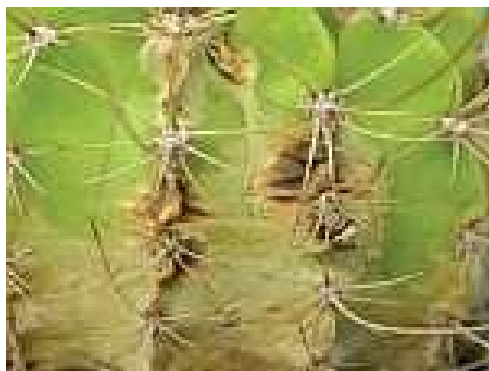
botrytis cinerea fert.