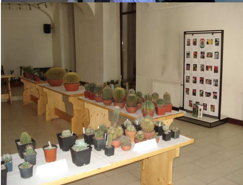
A jubileumi kiállítás egy részlete.