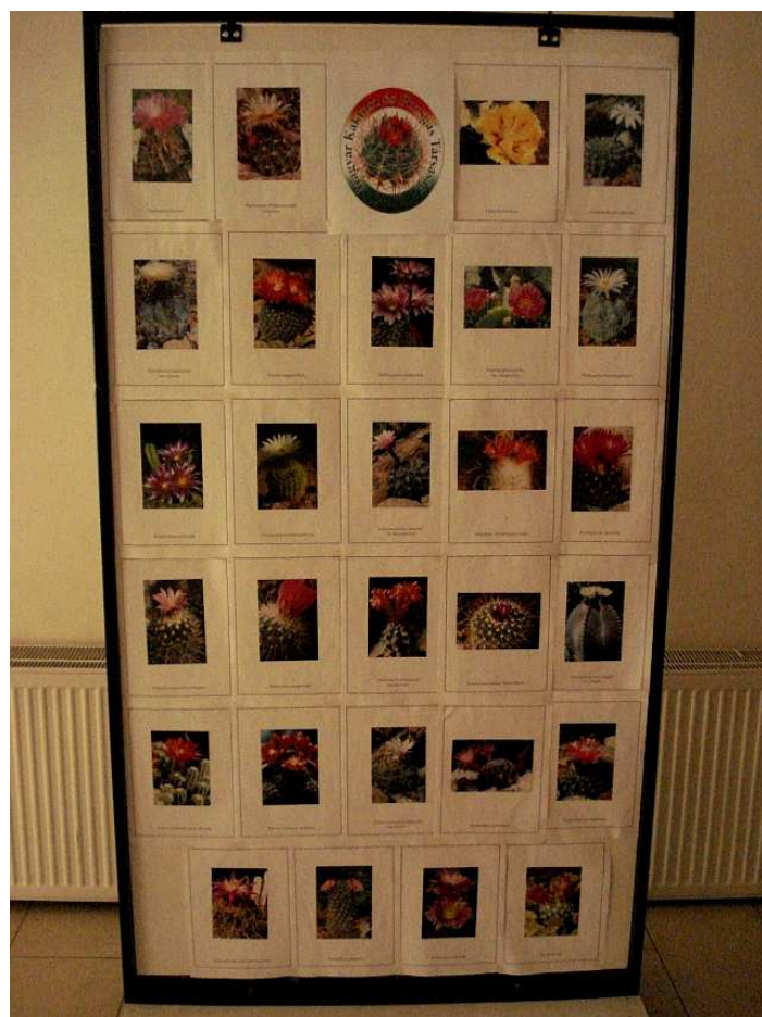
A Magyar Kaktusz és Pozsgás Társaság kiállítási tablója