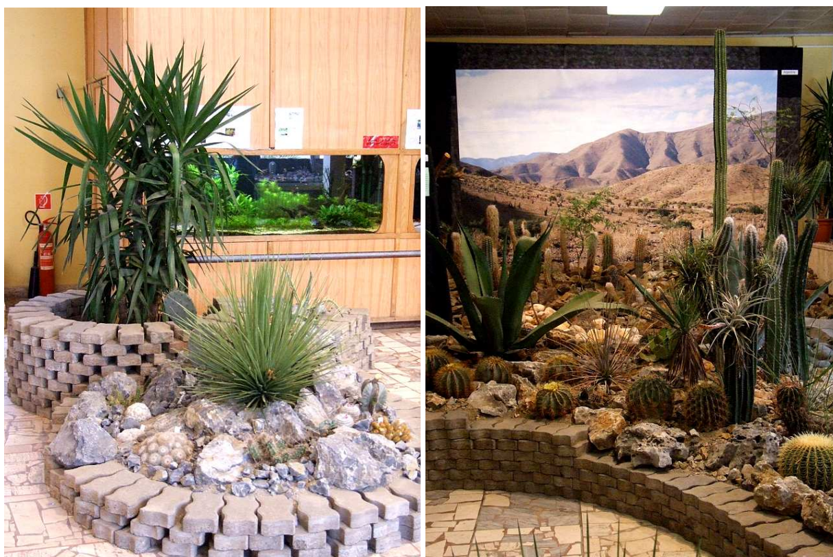
Sziklakert jukkával, agavéval és kaktuszokkal. A jobb oldali képen látható sziklakertnek mintha természetes folytatása lenne a háttérként alkalmazott hatalmas, textilre nyomtatott poszter.