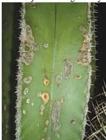
phoma torrens vírus fert.