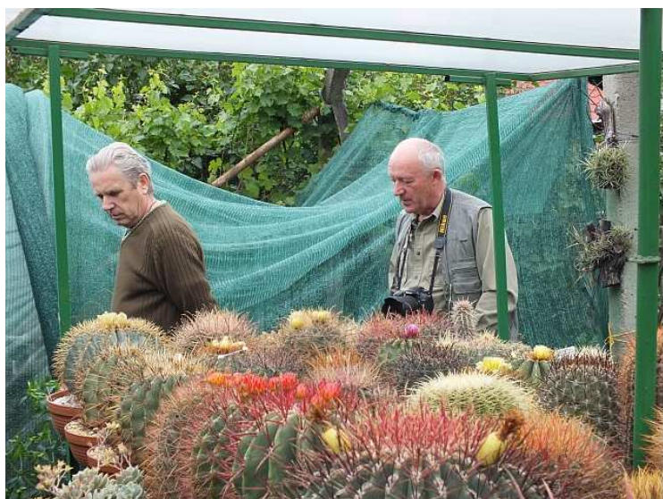
Termetes Ferocactusok csoportja.