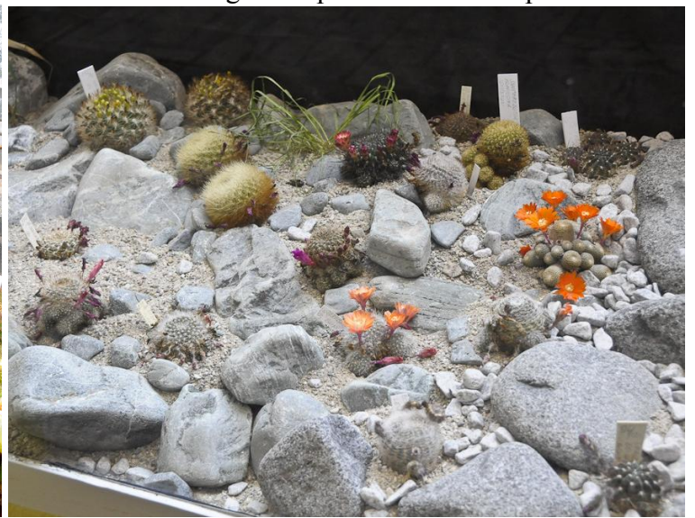
Sziklakert az üvegfall mögött.