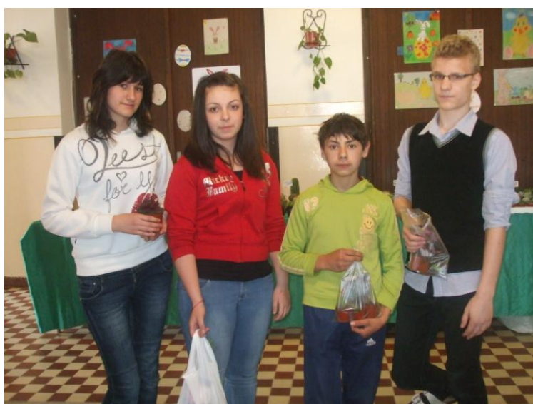
Az újfehértói Mályvaskerti Ált. Iskola díjazottai.