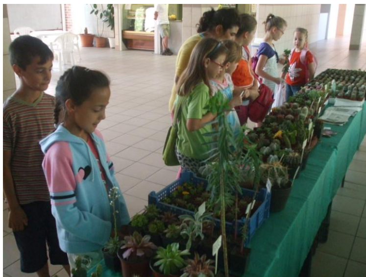
A létavértesi Arany János Általános iskola tanulói