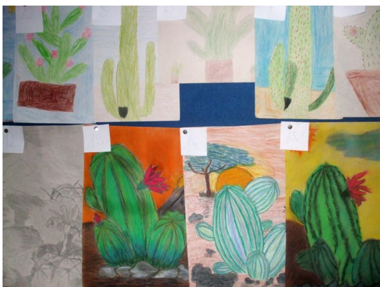
Az Újfehértói Mályvaskerti Ált. Iskola tanulóinak rajzai.