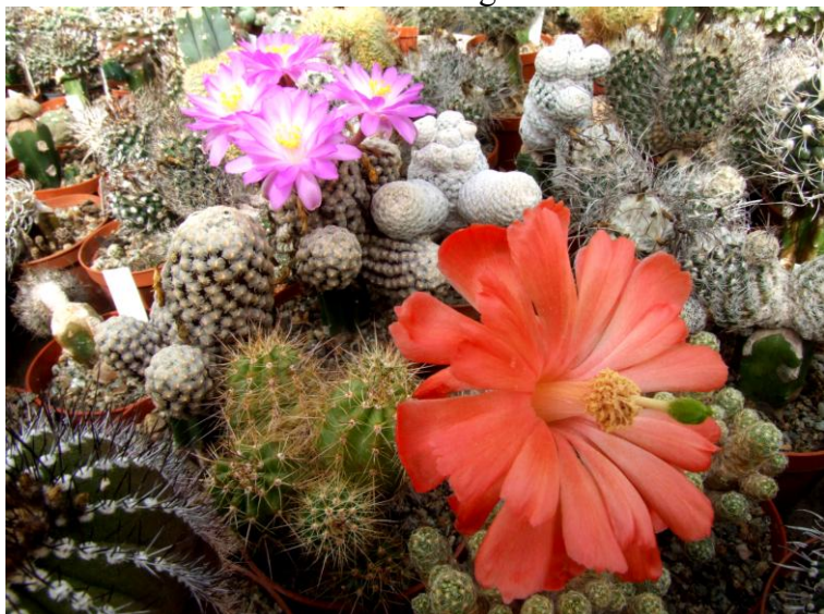
Csendélet az üvegfallon túl.