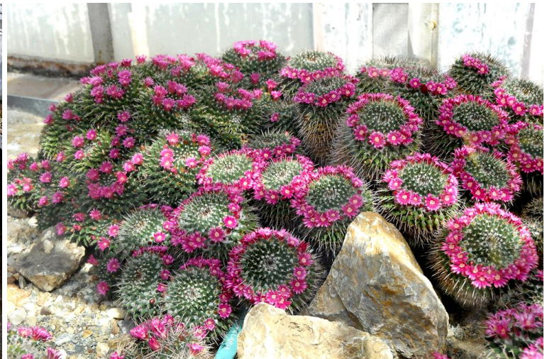
Mammillária geminispora hatalmas telepe.