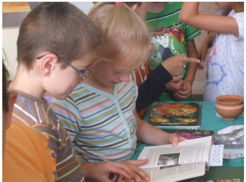
Hajdúszoboszlói iskola. Kiadványaink is érdekesek.