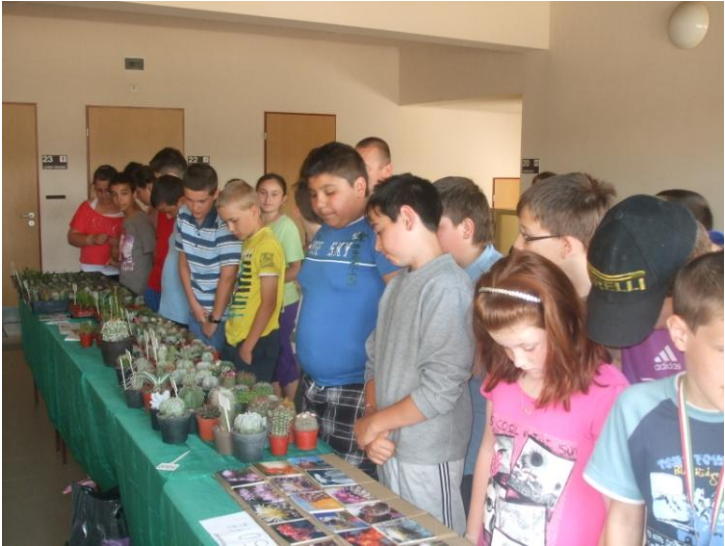
A biharkeresztesi iskolában.