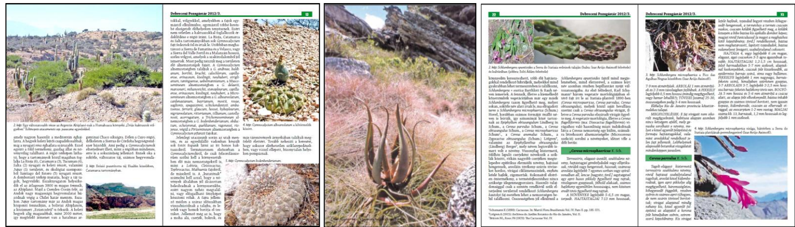
A legfrissebb Debreceni Pozsgástár néhány oldala.