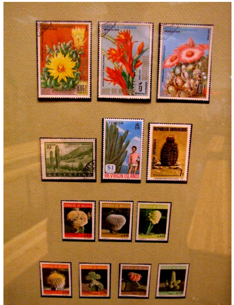
Néhány részlet a Soó Rezső bélyegkiállításról. A képek csak egy kis töredékét mutatják a teljes kiállításnak.