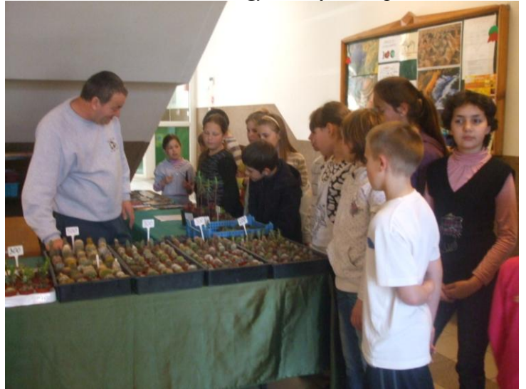
Az ebesi ált. iskolában.