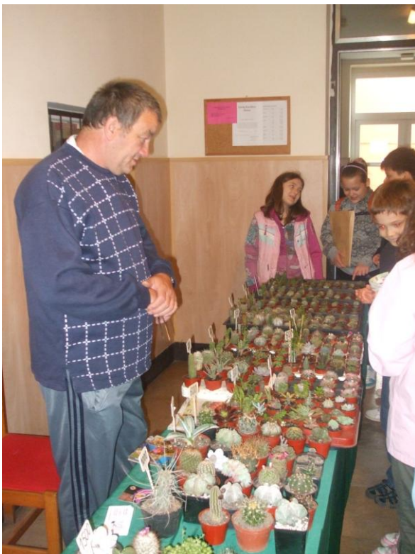
Debrecen, Ibolya utcai iskola.