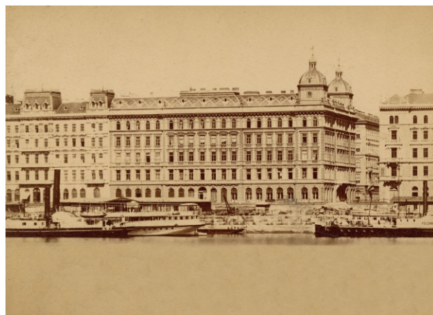
A pesti áru- és értéktőzsde az Aldumasoron, 1873 körül

nagy hatású városépítészeti szakírója, Camillo Sitte sok esetben idézett munkájában kiemeli a pesti Duna-part