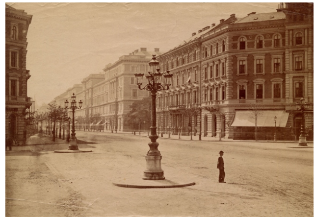
Az Andrássy út az Oktogontól a mai Jókai tér felé, Budapest, 1894 előtt

zárómotívumot kupolák, oromfalak sehol nem szakítják meg, így a főpárkány a teljes térfalat egyetlen ortogonális egységgé fűzi össze. Az egységes összképet középületek elhelyezésével sem kívánták megtörni. Jó példa erre az Operaház, amely egyetlen lakótömb területre épült, előtere szerény és tömege is csak fokozatosan emelkedik az előkelő bérpaloták fölé.