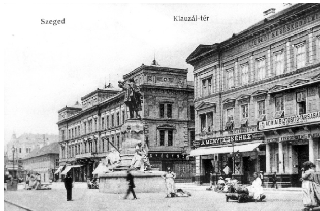
Klauzál tér, Szeged, 1910 körül

A neoreneszánsz városépítészeti kevésbé ismert, szép vidéki példája a rév-komáromi Klapka György tér beépítése. A teret a település egyik fő utcájára, a Nádor utcára