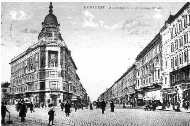
Az Andrássy út indítása a mai Bajcsy-Zsilinszky útnál, Budapest, 1896 után