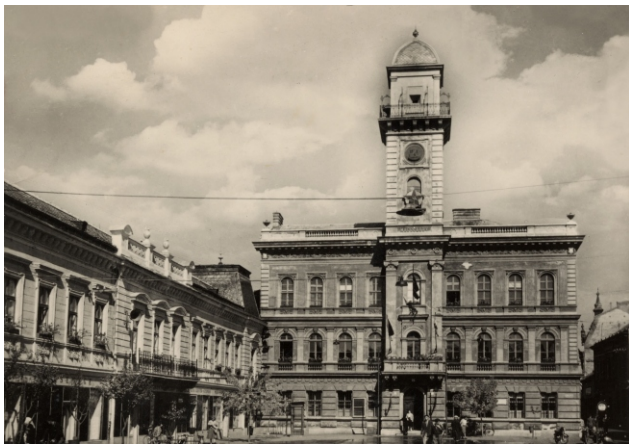
Klapka György tér, Rév-Komárom, 1960-as évek

merőlegesen alakították ki. Észak-déli főtengelyében a városháza tornyos, korai neoreneszánsz épülete áll. A tőle keletre eső egykori Tiszti Kaszinó épülettömege – igaz szerényebb formában – Stüler pesti Tudományos Akadémia palotájának reprezentatív tömegelrendezését követi. A teret nyugatról lezáró hosszú épület egyemeletes: egyszerűbb architektúráját északi és déli végében egy-egy manzárdtetős sarokszárny gazdagítja. A ki-egyensúlyozott, „szalonszerű” hangulatot Klapka