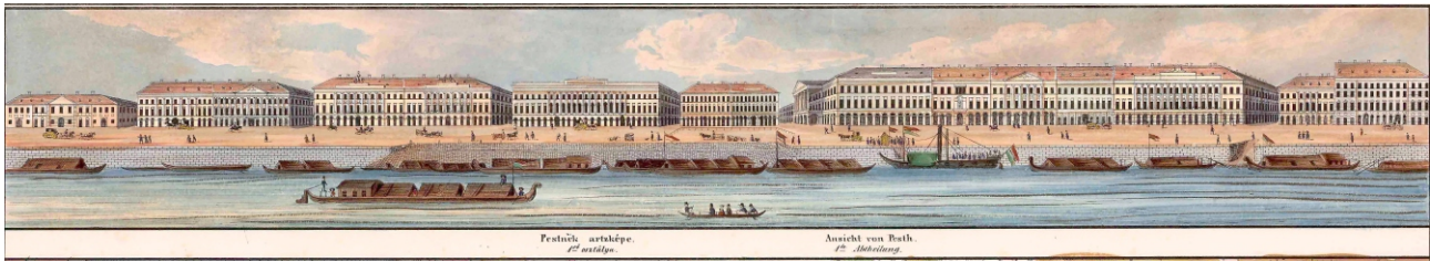
A pesti Duna-part képe, Franz Weiss színes litográfiája Carlo Pinos Vasquez Pest-Budát ábrázoló térképén, 1837–1838

Városháza (1890) tervezése során tett javaslatot a közepkori Fő tér szabályosítására és hálós utcarendszerrel történő kiegészítésére. 4