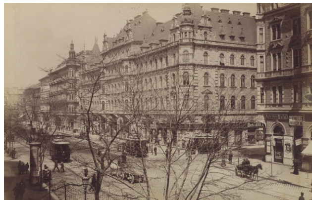
A Schosberger-bázis a budapesti Teréz körúton, 1890-es évek

terjengős piactérből. A téren áthaladó utcák viszonylag keskenyek és a tér sarkain érkeznek: nem jelölnek ki