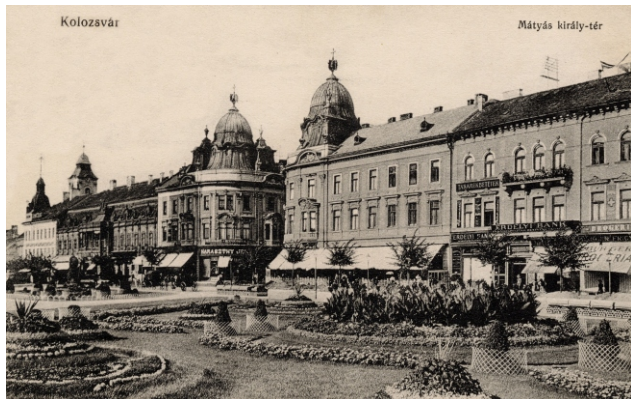
Kolozsvár főtere a Bánffy-palotával és a Status-palotákkal 1905 körül

A városépítészeti szemléletváltozását jól jellemezte a pesti Nagykörút kiépítése. A Nagykörút megalkotásának alap gondolatául minden kétséget kizáróan a bécsi körút, a Ring szolgált. 18 Bécsben azonban – híven a szigorú neoreneszánsz térszervező elveihez – a belvárost keretező „várkört” még egyenes térfalakkal határolták, így a