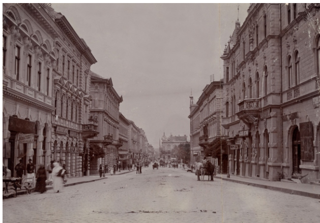
Híd utca a Széchenyi tér felé, Szeged, 1896 körül

és ezzel a homlokzatokon – hasonlóan a városszerkezet- hez és a telekosztáshoz – szabályos, hálós osztásrend- szer alakult ki. A számtalan példa közül itt minde- nekelőtt az Andrássy út városi palotáit említjük. 12