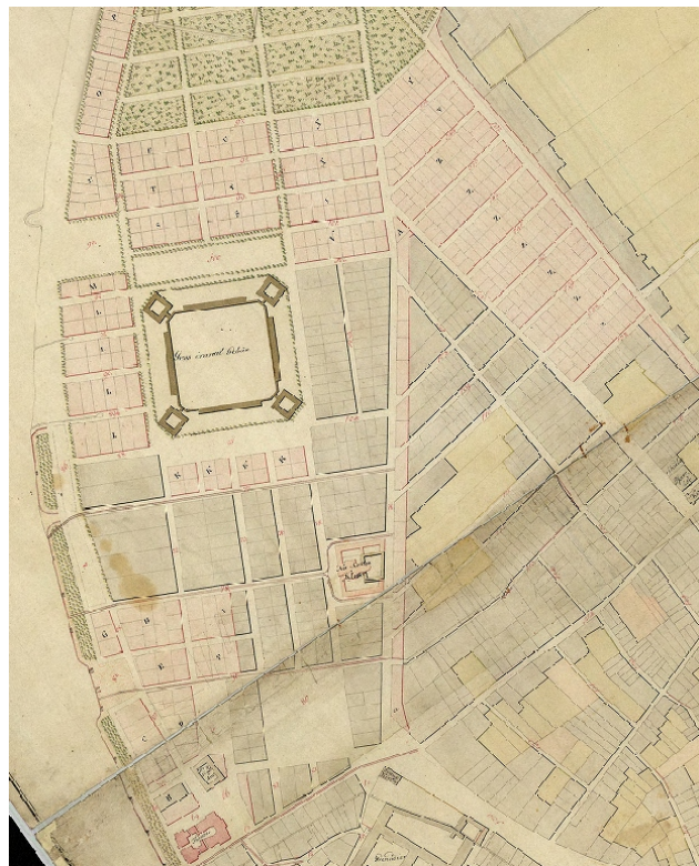
Hild János: Pest város belterületének belsőrajza és szabályozási terve, 1805. (részlet)

Az 1800-as évek első harmadában, a kora historizmus idején a városi mérnökök mindenkor az új utcák, terek, városrészek szabályos elrendezésére törekedtek. A városépítészeti kiindulópontja a hálós – sakktabla elrendezésű – településszerkezet és telekosztás volt. Az ortogonális hálóban való szerkesztésnek az egyenes vonalban vezetett utcák és a szabályos alaprajzú városi terek feleltek meg legjobban. A szabályosság – korabeli szóhasználatlaltal – „lehetőségig való kihasználásával” de-