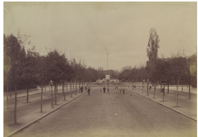
Az Andrássy út lezárása a mai Hősök terével, Budapest, 1894 előtt

nél is találkozunk: a Pesti Hazai Első Takarékpénztár székháza 14 és az Egyetemi Könyvtár 15 kupola-párja. Az útdíttások kupolás-tornyos saroképületekkel való hangsúlyozása a 19. század utolsó harmadában, a késő historizmus idején vált általánosan elterjedt megoldássá: a kolozsvári Status-paloták a Szentegyház utcában és a